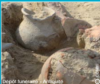
Dépôt funéraire - Antiquité