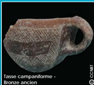
Tasse campaniforme - Bronze ancien