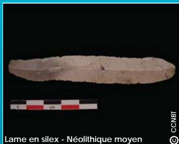
Lame en silex - Néolithique moyen

Dès 1981 Daniel Rouquette signalait la présence d'une nécropole de l'Antiquité tardive en bordure du chemin, au nord de la parcelle. Elle comptait quatre tombes des IV-Vème siècles de notre ère. L'ouverture à la pelle mécanique a permis la découverte de deux nouvelles tombes rattachées à cette nécropole. La première est une tombe en bâtière relativement bien conservée dans laquelle une femme a été déposée accompagnée de vases au niveau de ses membres inférieurs. La seconde sépulture a été installée dans les couches supérieures du remplissage de l'enceinte chalcolithique. Elle a été fortement abîmée par la charrue. Ainsi les données sur la méthode d'enfouissement et sur l'individu reste difficile à déterminer. Cependant l'hypothèse d'un dépôt en pleine terre avec l'individu enveloppé d'un linceul est avancée grâce la découverte d'une petite épingle en fer à sa proximité immédiate.